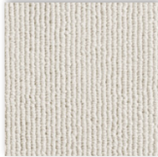
39 4m + 5m