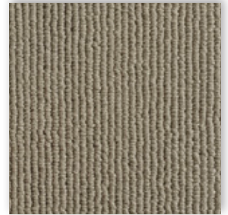
29 4m + 5m

La société Associated Weavers se réserve le droit de modifier les caractéristiques de ce produit tout en conservant les mêmes qualités techniques. Il est fortement conseillé d'utiliser les coloris moyens et foncés pour les pièces à grand trafic.