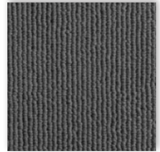
99 4m + 5m