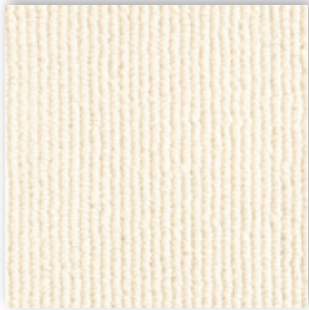
03 4m + 5m