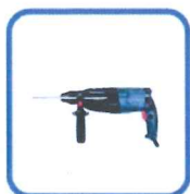
Bormașină cu percuție